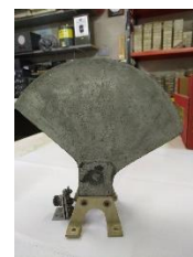
Condensor Bank Impedantie koppelaar voor magnetische loopantenne Antenne ???